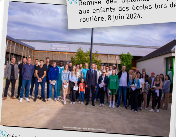
Cérémonie de récompense aux athlètes des associations villersois, 14 juin 2024.