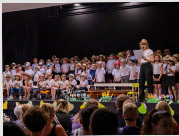
Spectacle de fin d'année de l'école Le Plateau, 24 juin 2024.