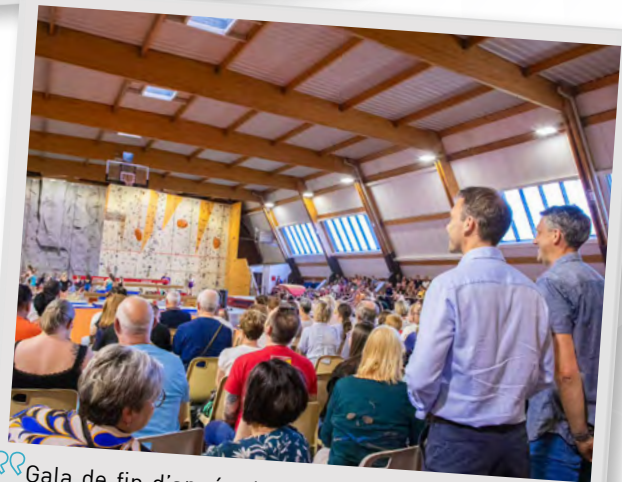
Gala de fin d'année de La Villersoise Gymnique, 28 juin 2024.