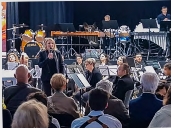
Concert de l'Harmonie SNCF, 16 juin 2024.