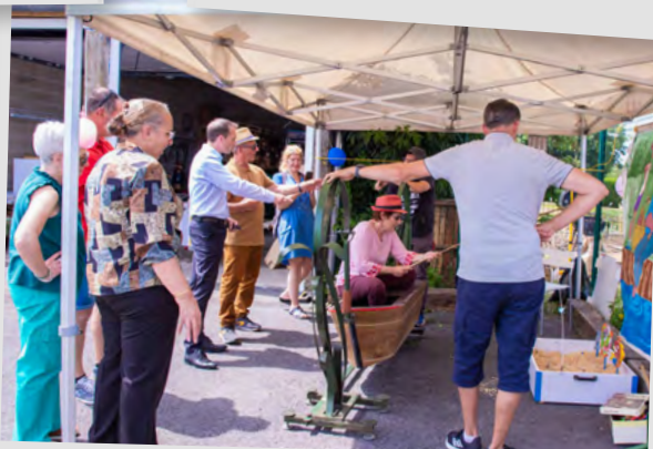
10 ans du Sel'Arden, 29 juin 2024.