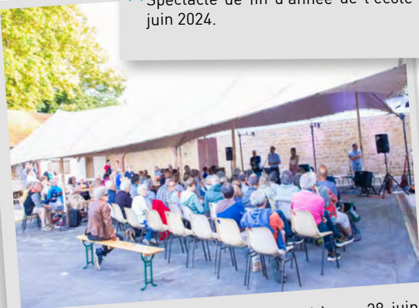
Premier conc'air d'été de la médiathèque, 28 juin 2024.