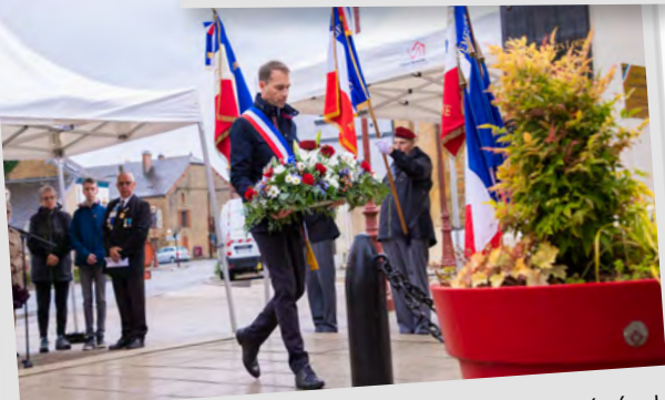
Cérémonie commémorative de l'appel du Général de Gaulle du 18 juin 1940 à refuser la défaite et à poursuivre le combat contre l'ennemi, 18 juin 2024.