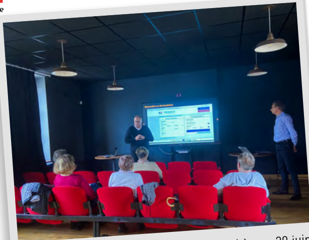
Atelier numérique Orange à la médiathèque, 20 juin 2024.