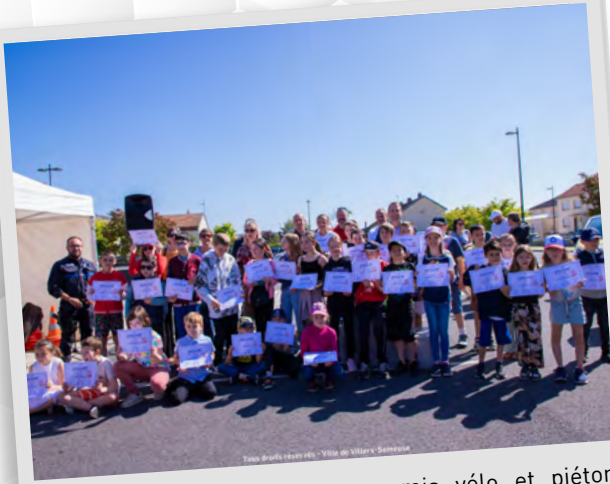
Remise des diplômes du permis vélo et piéton aux enfants des écoles lors de la journée sécurité routière, 8 juin 2024.