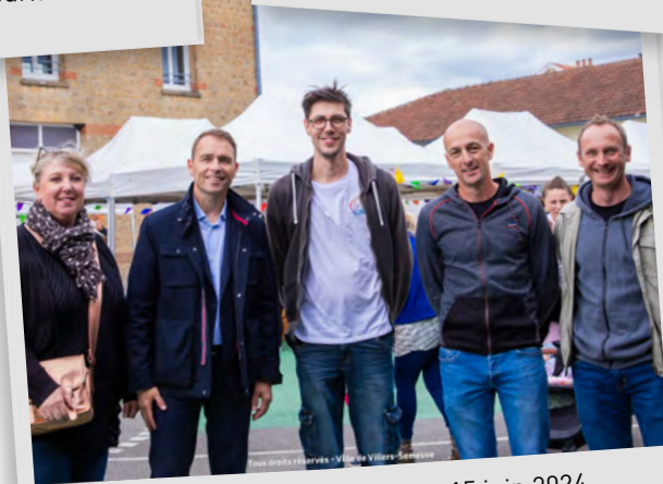
Kermesse des Echos du Plateau, 15 juin 2024.