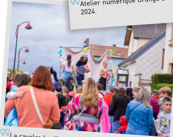
La cavalcade villersoise, 22 juin 2024.