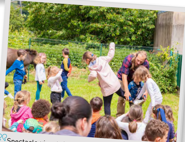
Spectacle vivant de bibliogysmo dans les écoles, 17 juin 2024.