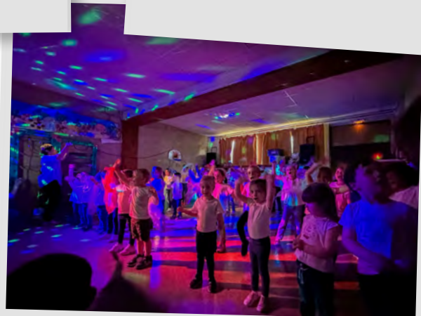
Spectacle de fin d'année de l'école Semeuse, 18 juin 2024.