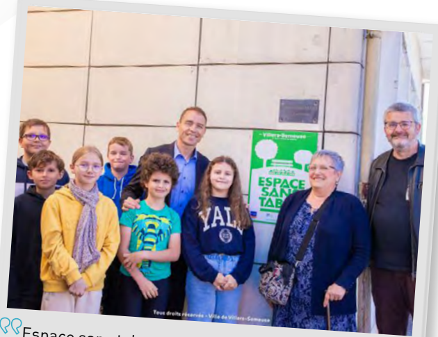
Espace sans tabac devant les écoles, médiathèque et A.L.S.H., 13 juin 2024.