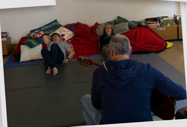
La sieste acoustique, 22 juin 2024.