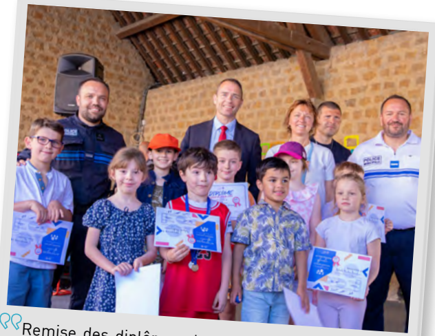
Remise des diplômes du permis vélo et piéton aux enfants des écoles par la Police Municipale, 3 juin 2023.